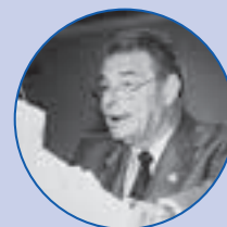
Altbundesrat Jean-Pascal Delamuraz

«Der Staat muss stark bleiben, aber er darf nicht glauben, dem Bürger die Lösung jedes noch so kleinen Problems abnehmen zu müssen. Der allumfassende Hochleistungsstaat scheitert. Er ist nicht finanzierbar, und er erfüllt die Erwartungen nicht, die man an ihn stellt. Deshalb verliert er zwangsläufig an Vertrauen. Nach wie vor sollten wir den Satz von Montesquieu beherzigen: «Wenn es nicht nötig ist, ein Gesetz zu machen, ist es nötig, kein Gesetz zu machen!»»