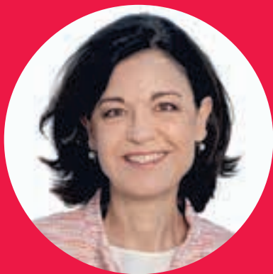
Regine Sauter Nationalrätin FDP ZH

«Die Fehlanreize im Gesundheitswesen verteuern das System. Heute werden Leistungen erbracht, die den Patientinnen und Patienten keinen Nutzen bringen. Die Reform packt dieses Problem an. Damit werden Kosten gesenkt und die Versorgung gestärkt.»