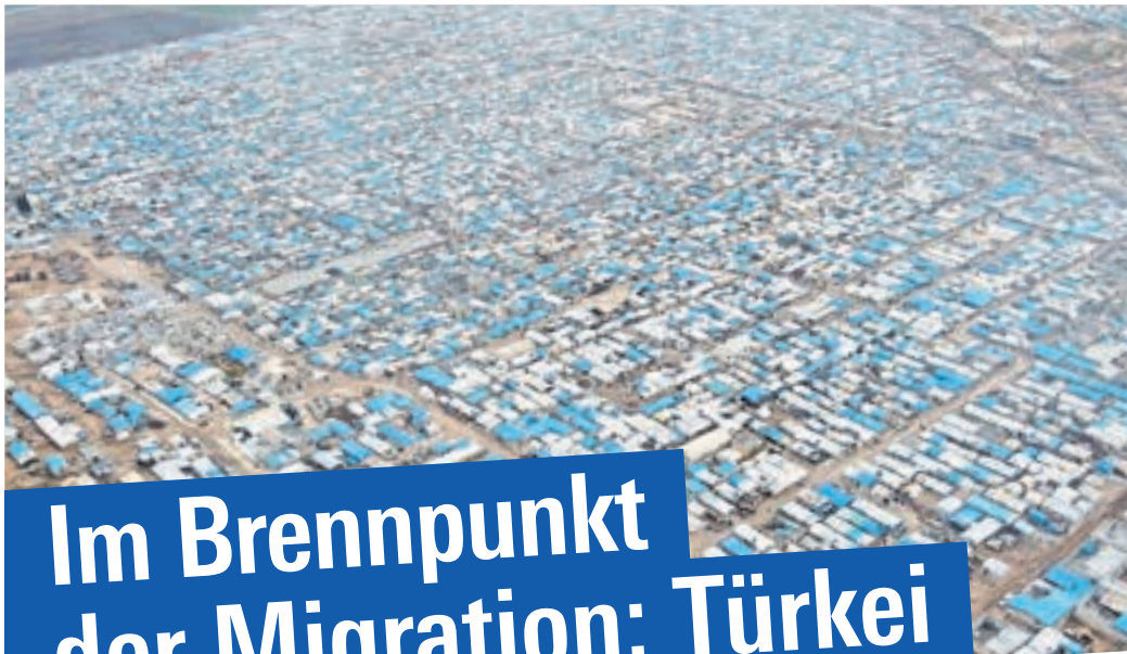
Flüchtlingslager syrischer Flüchtlinge an der türkischen Grenze (2020), Bild: iStock, News Cameraman Video Journalist