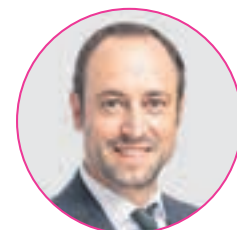
Christian Wasserfallen, Nationalrat BE und Mitglied UREK-N

JA zu leistungsfähigen Autobahnen ohne Stau!