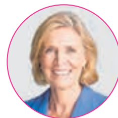
Patricia von Falkenstein, Nationalrätin LDP Kanton Basel-Stadt