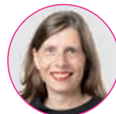
Bettina Balmer, Kinderchirurgin und Nationalrätin ZH