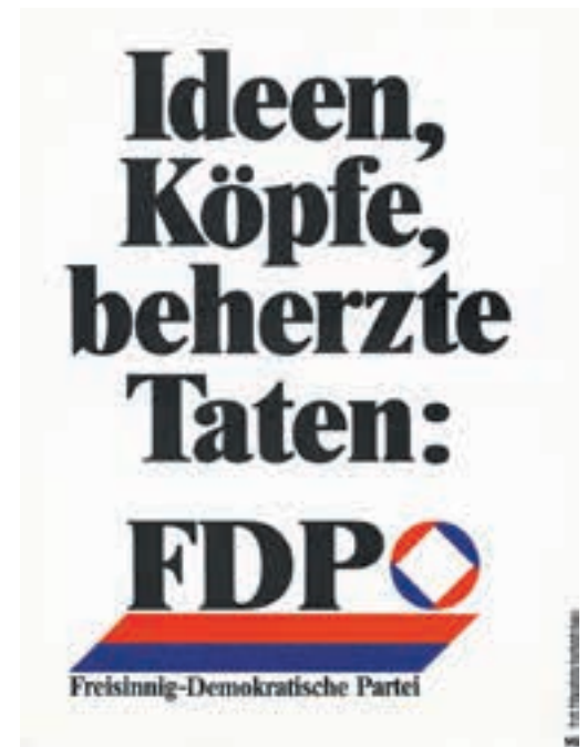
«Ideen, Köpfe, beherzte Taten: FDP»; Wahlplakat der FDP anlässlich der Nationalratswahlen vom 21. Oktober 1979, Quelle: «Schweizerisches Sozialarchiv», F Pb-0004-026.

Freilich ist Liberalismus anspruchsvoll. Freiheit ist immer auch ein Tasten ins Ungewisse. Die Angst, einer Verantwortung nicht gewachsen zu sein, kann Schwindel auslösen. Andererseits vermag verantwortete Freiheit die hehrsten Gefühle des Menschen anzusprechen. Auf ihrem Feld geht es um Bewährung oder Versagen, Ehre oder Schande, Autonomie oder Knechtschaft. Ist der Anspruch