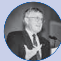
Altbundesrat Kaspar Villiger

Auszüge aus den Reden zum Hundertjahrjubiläum: