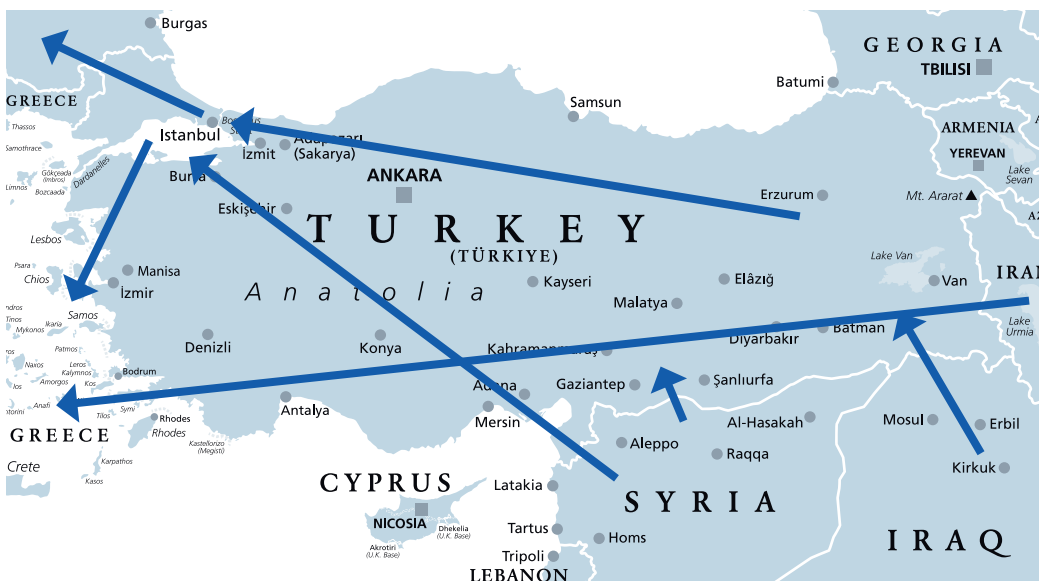
Migrationswege in die und aus der Türkei.

abgeschoben werden. Im Gegenzug sagte die EU zu, schutzbedürftige Personen aus der Türkei aufzunehmen. Zudem versprach die EU bis Ende 2018 sechs Milliarden Euro für Projekte in der Grundversorgung, Gesundheit und Bildung für Flüchtlinge zu. Im Juni 2021 sagte sie weitere drei Milliarden Euro zu. Die Zahl der illegalen Migranten ist seither massiv zurückgegangen. Gleich-