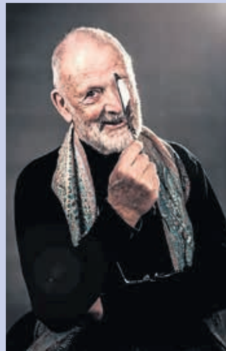
François Loeb, Nationalrat BE (1987–1999)

www.francois-loeb.com/kurzgeschichten-kostenlos-lesen/geschichten-erhalten/